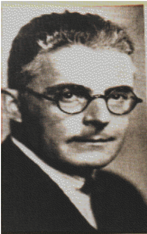
John Broadus Watson (1878 - 1958)

Physiologiste russe nommé à la fin du XIX siècle à l'Institut de Médecine expérimentale. Il y travaille sur les mécanismes de digestion et le rôle des sécrétions glandulaires. En mesurant la quantité de sécrétion de sucs gastriques chez des chiens, il observe que les animaux ne salivent pas seulement en mangeant, mais aussi à la vue de la nourriture ou de la personne qui l'apporte. Ces observations ont été l'origine de la découverte du réflexe conditionné.